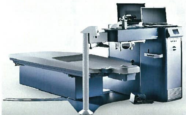
ドイツ製 ALLEGRETTO Blue-Line

当院で使用していた従来の機種より、より高度で精密なレーザー照射が可能となりました！