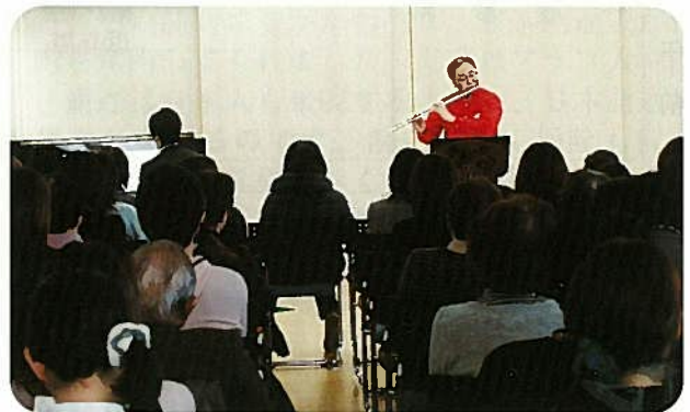
初開催ながら満席になるほどの盛況ぶりでした