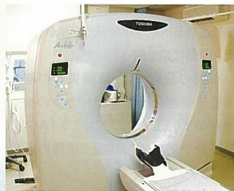
全身用X線CT診断装置(16列マルチスライス)