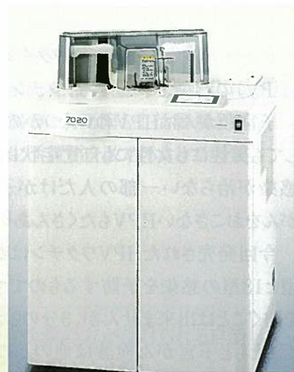
日立自動分析装置7020

この機器は、患者様の緊急検査として、肝機能検査、腎機能検査、膵機能検査、脂質検査、炎症反応の検査に使用しますが、新たにHDL(善玉)コレステロール、LDL(悪玉)コレステロールの測定が可能となり、脂質代謝異常症の患者様に対しても有用になりました。更に生化学検査の精度が向上し、検査時間が短縮されたことにより、急病の患者様の待ち時間短縮につながりました。今後も臨床検査室として緊急時の検査を迅速かつ円滑に行い、患者様に適切な診療と治療を受けて頂けるよう努力してまいります。