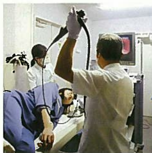
人間ドックの様子(経鼻内視鏡検査)

人間ドック、乳がん検診用の健診服が前開きになり、各検査がスムーズに行えるようになりました!!