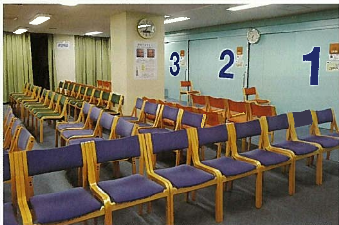
眼科外来の待合室