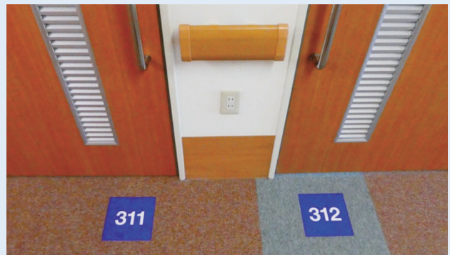
ロービジョンの方でも食事を楽しんで頂けるよう料理とのコントラストを考えた食器 (左) ・うつむき姿勢の方にも配慮した病室表示 (右)

内科は糖尿病の教育入院や肺炎・消化器疾患の患者様が入院されます。病状により病気になる前の生活に戻ることが困難な方もいます。退院後の日常生活やお薬の管理など不安を抱えている方も多く、入院中からソーシャルワーカーと連携し退院後の生活の調整を行っています。