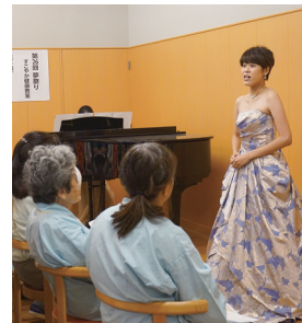
写真は昨年の開催風景